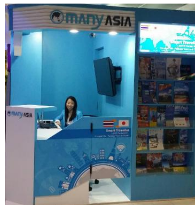
■スワンナプーム国際空港内ブース